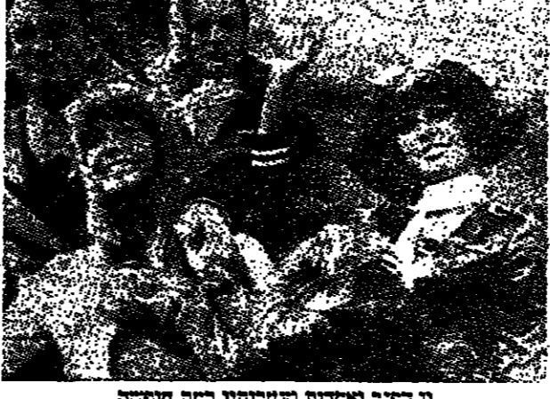
יו הפנר מספר על עלייתה של קיסרות פלייבוי

הפנר מספר על עלייתה של קיסרות פלייבוי. הוא מספר על הדרך בה הוא הפך ליועץ אישי לנשיא ארצות הברית, רונלד רייגן. הוא מספר על הדרך בה הוא הפך ליועץ אישי לנשיא ארצות הברית, רונלד רייגן. הוא מספר על הדרך בה הוא הפך ליועץ אישי לנשיא ארצות הברית, רונלד רייגן. הוא מספר על הדרך בה הוא הפך ליועץ אישי לנשיא ארצות הברית, רונלד רייגן.